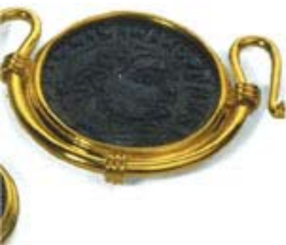
Serie sieraden met Romeinse munten