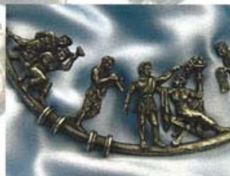
Collier met voorstelling gebaseerd op Griekse mythen en verhalen