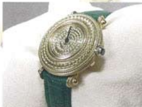
Nieuwste ontwerp: een dameshorloge