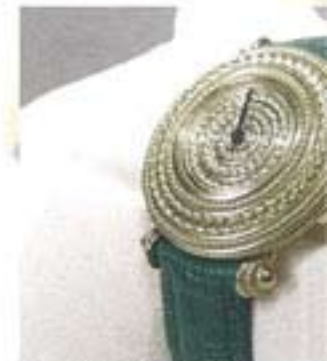
Nieuwste ontwerp: een dam...

zei dat er voor mij ook een bedrijf, de Platinum Custom Madison Avenue. Dat was mijn school. Ik mocht er ontwerpen. Ik mocht er ontwerpen van de goudsmid. Ik mocht er ontwerpen van de zeer rijke particulieren en van Harry Winston, wanneer hij zijn eigen atelier. Op een Bvlgari-advertentie in de... oorsieraden die ik net... natuurlijk hartstikke leuk.