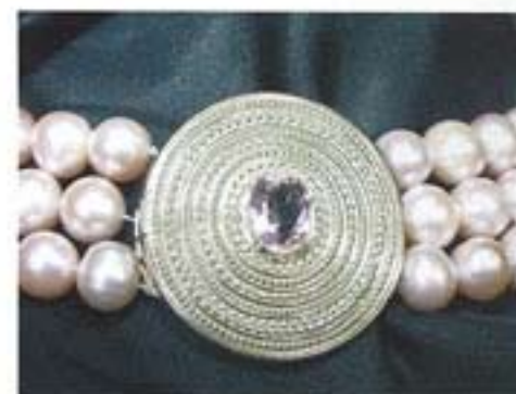
Geelgouden collier met grote roze zoetwaterparels en een solitair morganiet, de roze variant van de aquamarijn