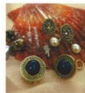
Een greep uit de collectie met parels en kleurstenen

Brigitta Sueters aan het werk in haar atelier: 'De werkplaats van goudsmeden is meestal rommelig'