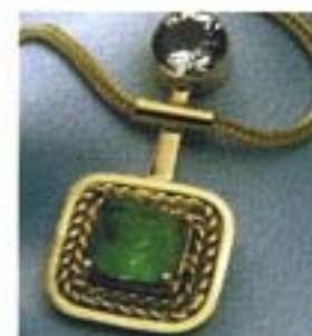
Geelgouden collier met smaragd en bergkristal