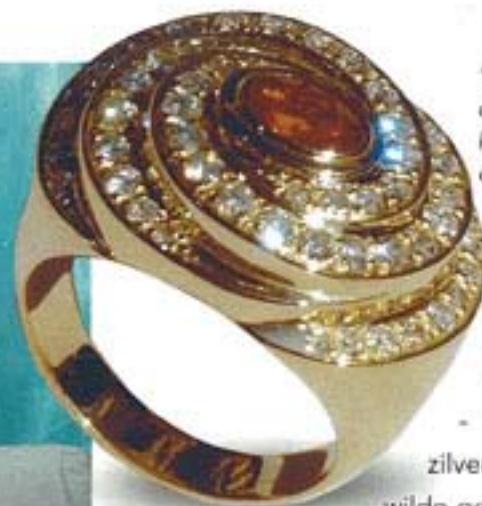
'De oranje saffier in deze ring had de klant al. Ik heb er dit ontwerp van gemaakt'

Als zesjarige wilde ik al goudsmid of schilder worden. Mijn zus zat op de kunstacademie en volgde daar de opleiding driedimensionale vormgeving. Ze maakte theelepeltjes en ik dacht: 'Dat