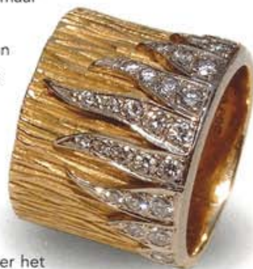
Geelgouden ring met witgouden en briljanten vlammen