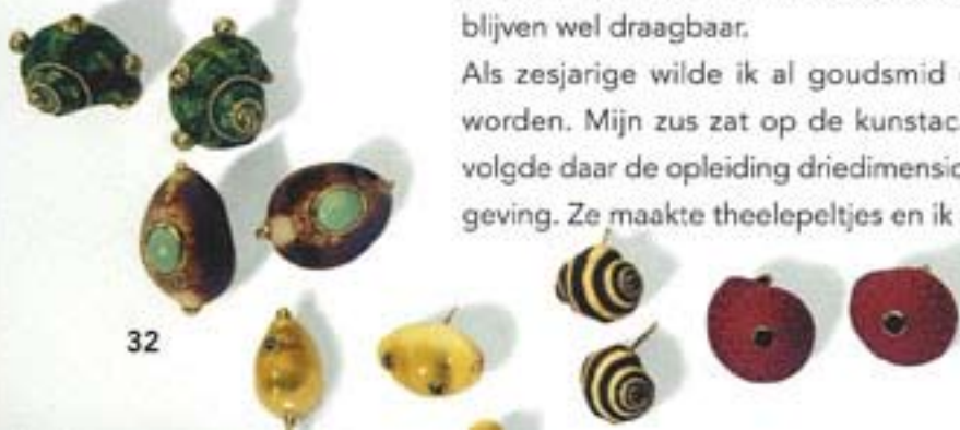
Filippijnse en Afrikaanse schelpen omgewerkt tot sieraad

Ik ben eerst naar de kunstacademie gegaan, maar zag al na korte tijd dat je daar helemaal geen techniek leerde. Ik koos dus snel voor de Vakschool in Schoonhoven. Na de Vakschool heb ik zeven jaar in New York gewerkt. Een vriendin van de Vakschool was Amerikaanse en haar baas